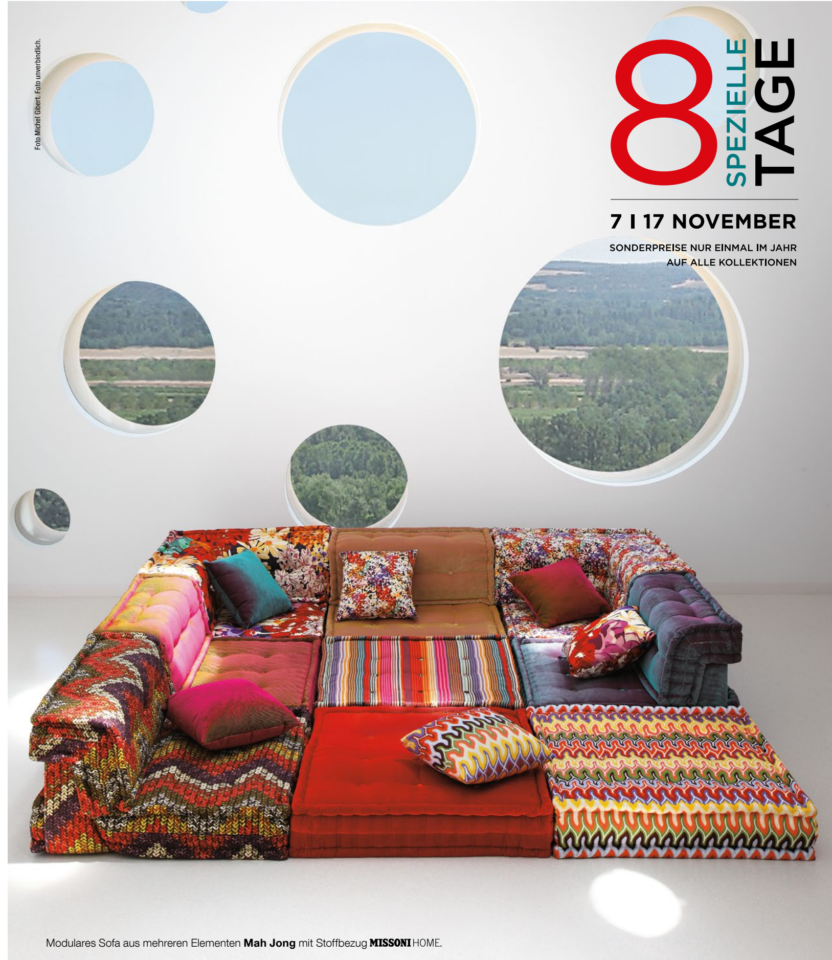
Modulares Sofa aus mehreren Elementen Mah Jong mit Stoffbezug MISSONI HOME .

SONDERPREISE NUR EINMAL IM JAHR AUF ALLE KOLLEKTIONEN